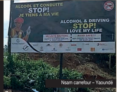
Nsam carrefour – Yaoundé