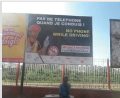
Yaoundé - Pont de la gare