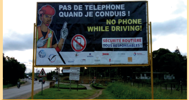
Edéa - visible en allant vers Douala