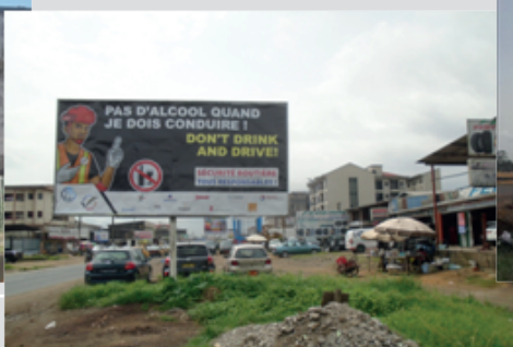
Douala - Sable face Hôtel Serena